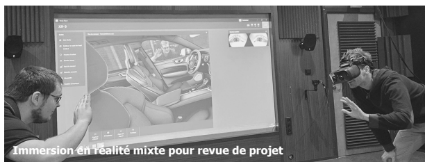
Immersion en réalité mixte pour revue de projet

Création d'un Bachelor "Assistant Ingénieur" Mutations Technologiques et Industrielles spécialité Génie Civil et Environnement, répondant aux besoins de recrutement en management intermédiaire des entreprises